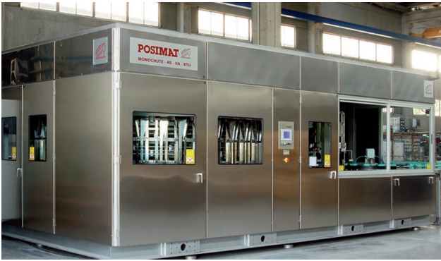
具备POSIFLEX款-A型换瓶系统的MONOCHUTE款-40型理瓶机， 一体机BTU*瓶子传输单元并具备隔音功能的隔间式不锈钢单体设备。