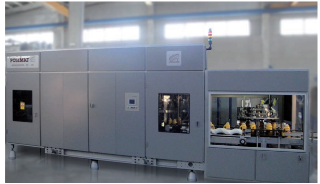
具备POSIFLEX款-A型换瓶系统的MONOCHUTE款-45型理瓶机， 并一体机旋转式定向器的单体设备。