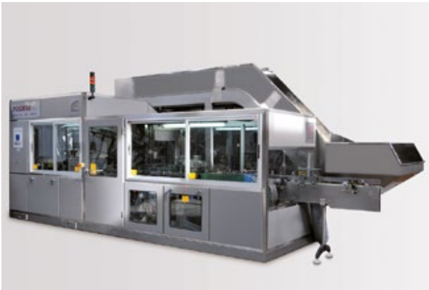
ACCESS N-20型整理机和空气清洗机的一体式设备