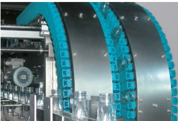
高速空气清洗机内部 清洗瓶子或罐子内部