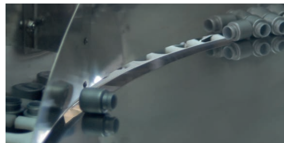
Detailansicht Innenraum des Flaschenaufrichters POSIPHARMA-13

Die Flaschen gelangen über ein Zuführförderband in den Aufrichter. Sie werden auf der sich drehenden Sortierscheibe (1) so verteilt, dass sie in die Zentrierfächer (2) fallen. Dies erfolgt ohne jegliche mechanische Hilfe: nur durch Druckluft und Schwerkraft.