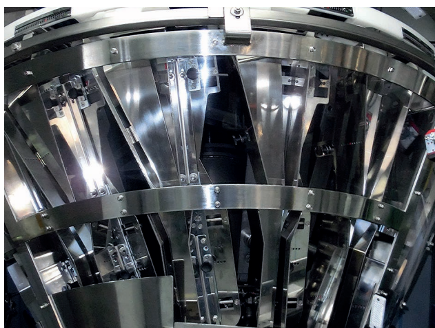
Modèle de redresseur POSIFLEX-M-15 de la série ACCESS

Changement de format pouvant être utilisé aussi bien avec les équipements de la série ACCESS (en cabine) qu'avec ceux de la série MASTER (protection fixe).